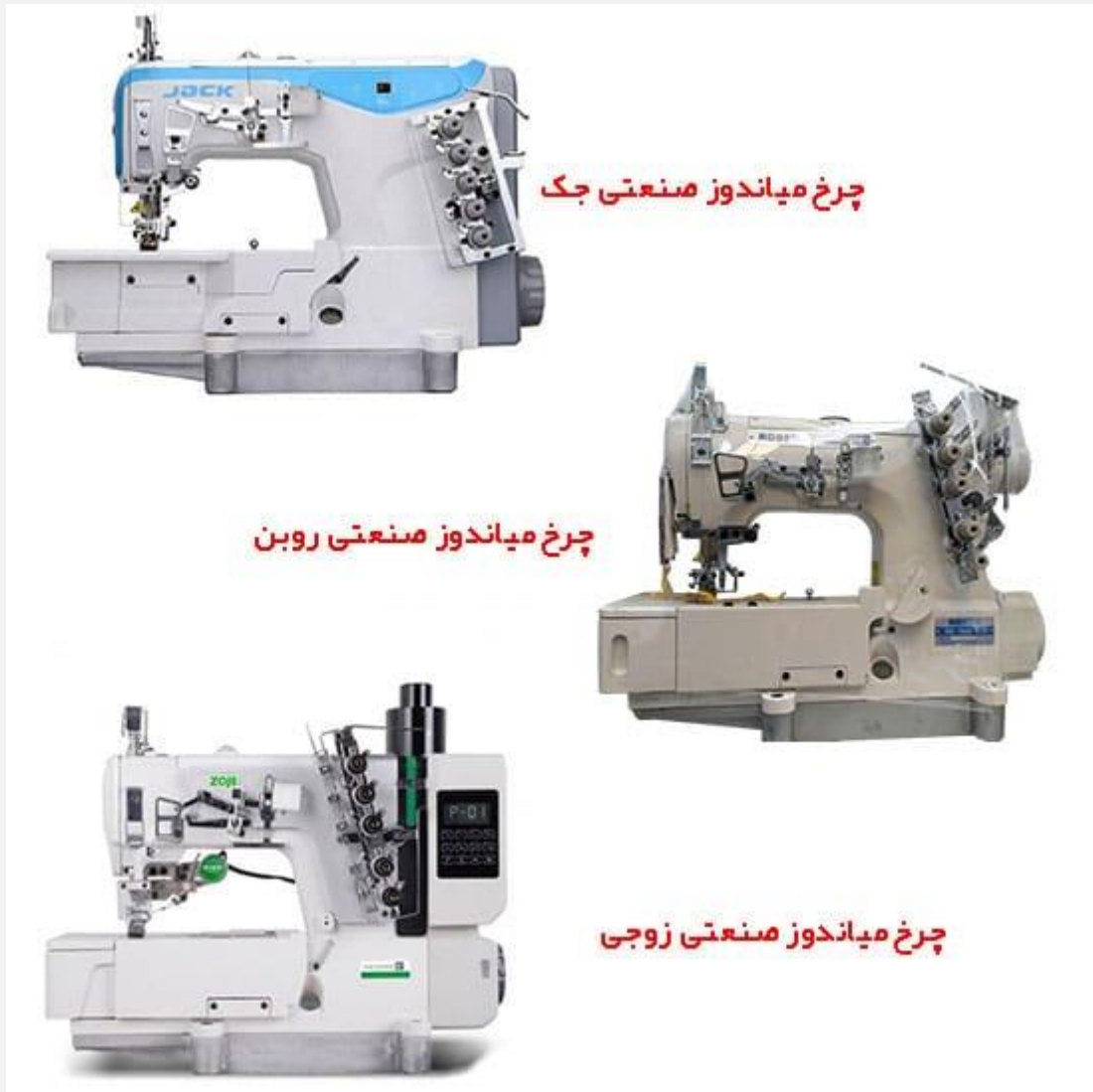
چرخ میاندوز صنعتی جک